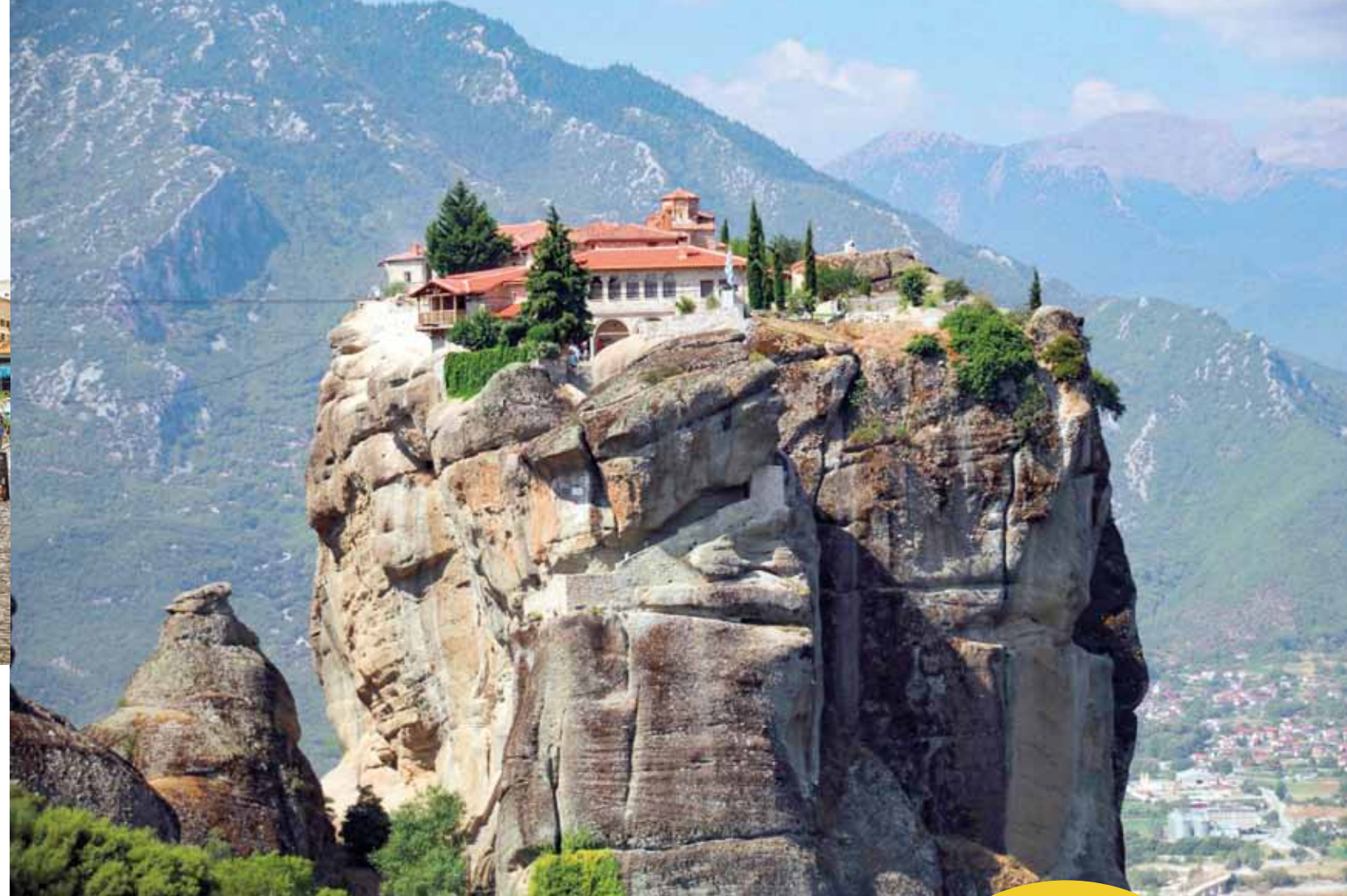
LES MÉTÉORES, GROUPE DE MONASTÈRES LE PLUS GRAND ET LE PLUS IMPORTANT DE GRÈCE APRÈS CEUX DU MONT ATHOS. LEUR EXISTENCE REMONTE AU XI ème SIÈCLE.