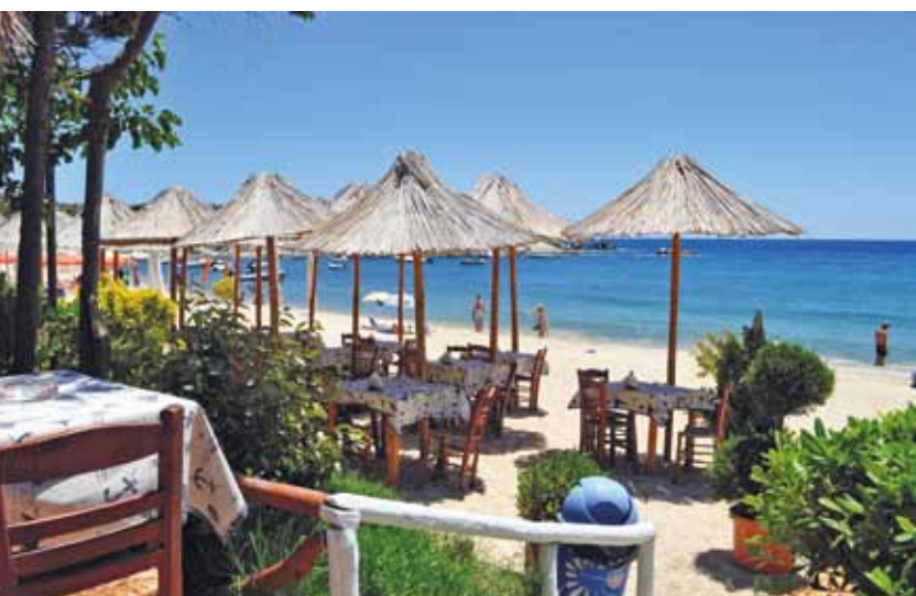
SITHONIA, LA DEUXIÈME DES TROIS «JAMBES» DE LA PRESQU'ÎLE DE LA CHALCIDIQUE, REGORGE DE CRIQUES IDYLLIQUES ET PEU FRÉQUENTÉES.

Situé sur la presqu'île de Kassandra à 80 km de Thessalonique, Sani Resort est un splendide complexe touristique constitué de quatre hôtels et d'une marina, répartis sur un magnifique domaine de 400 hectares. Cette vaste étendue est agrémentée d'une abondante flore méditerranéenne qui lui donne un caractère quelque peu sauvage, tout en permettant de séparer et d'isoler les différentes résidences. L'ensemble du Sani Resort est formé par Sani Astérias, le plus intime avec 57 suites, un élégant restaurant et une marina, Sani Club et ses petits bungalows en pierre dont certains avec piscine privée, plusieurs restaurants qui servent de la cuisine locale et internationale et les deux autres Porto Sani et Sani Beach tous avec le même confort. Vous pouvez pratiquer bon nombre d'activités sportives dans le cadre du Sani Resort et pour le golf, il faut se rendre à Porto Carras sur la péninsule de Sithonia toute proche. Le Porto Carras Golf Course est un 18 trous, par 72, dessiné en 2003 par Roy Machary.