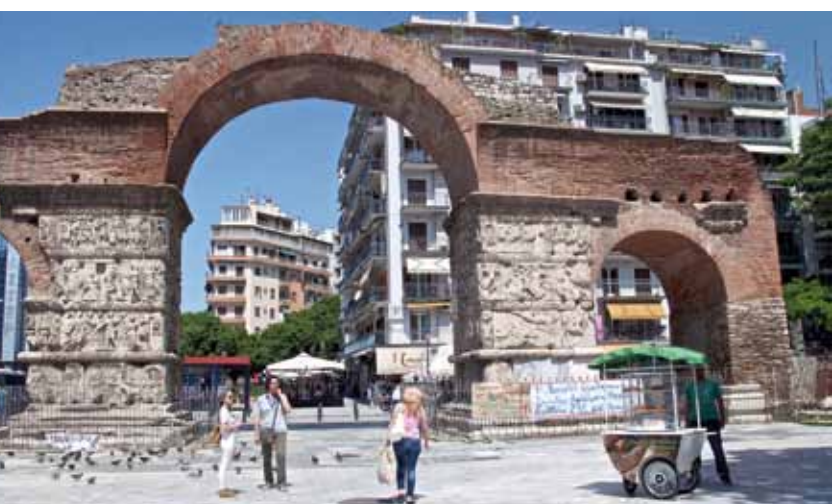
KAMARA, L'ARC DE L'EMPEREUR ROMAIN GALÈRE (IV ème SIÈCLE) ET SES BAS-RELIEFS RACONTENT LES GUERRES CONTRE LES PERSES (297 À 298 APRÈS J.-C.).