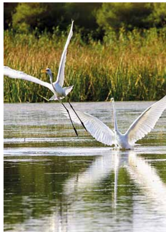
KASSANDRA HÉBERGE PLUS DE 180 ESPÈCES D'OISEAUX.