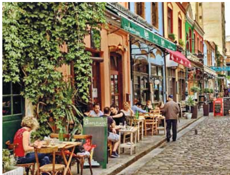
VILLE ÉTUDIANTE, THESSALONIQUE EST RENOMMÉE POUR SES FESTIVALS ET SA VIE NOCTURNE, SURTOUT SUR LA CORNICHE AVEC DES BARS ET CLUBS TRÈS TENDANCE!