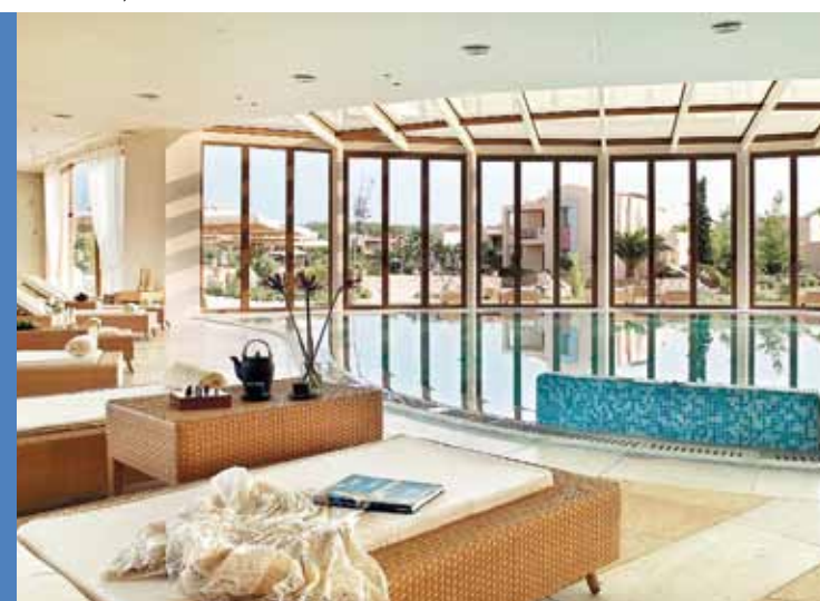
LE LUXUEUX SPA DU SANI RESORT.